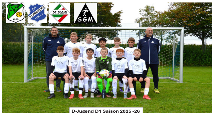
D-Jugend D1 Saison 2025 -26