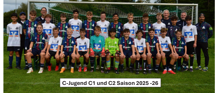
C-Jugend C1 und C2 Saison 2025 -26