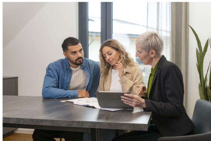
Fachleute aus der Energieberatung klären auf, ob sich die Kombination PVT-Modul und Wärmepumpe im eigenen Haus lohnt.

Aktuelle Informationen zur energetischen Sanierung von Wohnhäusern gibt es auch auf www.zukunftaltbau.de .