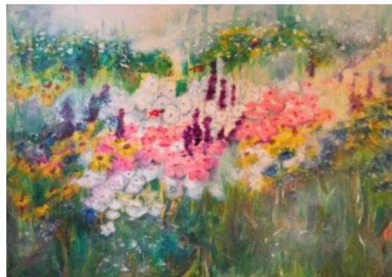
Der schönen Gärten Zier

Neben der Malerei ist die Künstlerin auch als Erzählerin von Märchen für Kinder und Erwachsene aktiv.