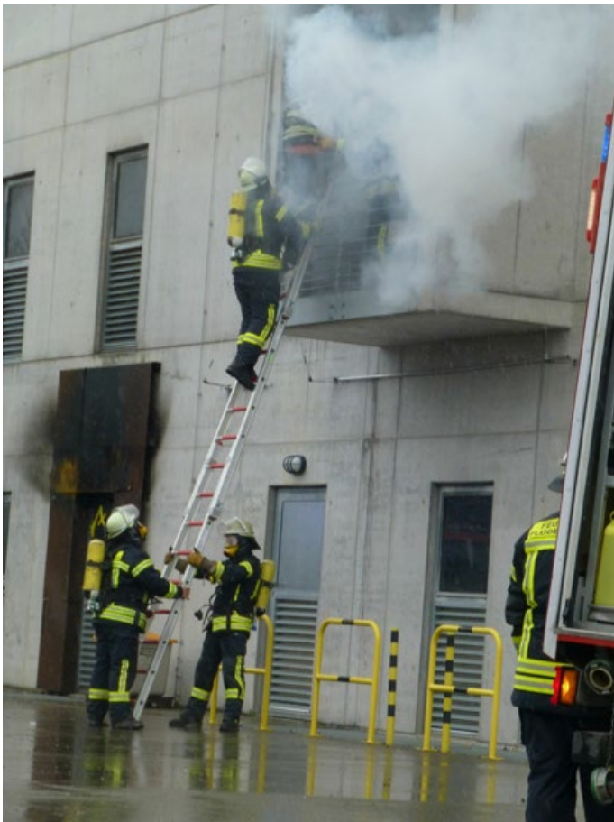
Löschen eines Gebäudebrands bei einer Feuerwehrrückübung; Fotografie: Regierungspräsidium Tübingen, Dr. Daniel Hahn.