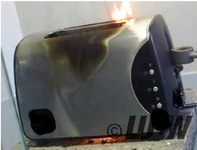
Brennender Toaster