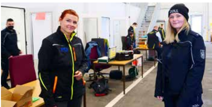
Mitarbeiterinnen und Mitarbeiter der Marktüberwachung und des Zolls